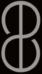
EXHIBIT 8 GALLERY